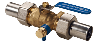
Uitvoering: 282004 met Wavin Tigris