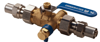
Uitvoering: 282003 met Uponor