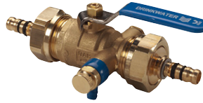
Uitvoering: 282004 met Geberit Mepla