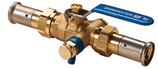
Uitvoering: 282003 met Henco Press