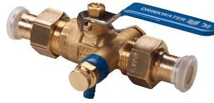
Uitvoering: 282003 met Geberit Mapress