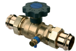
Uitvoering: 280003 met Viega Profpress