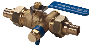
Uitvoering: 282003 met Viega Pexfit