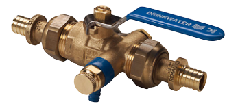
Uitvoering: 282003 met Rehau Rautitan